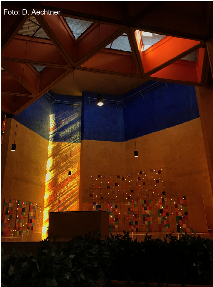
Altarraum von der Versöhnungskirche in Taizé